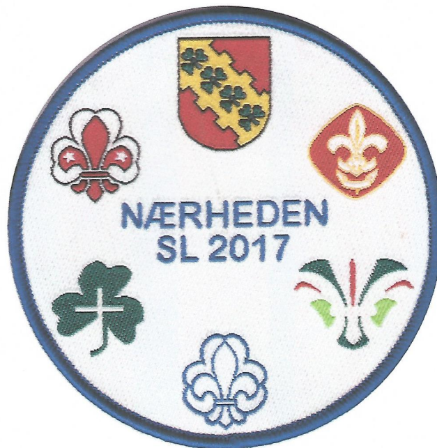
Tværkorpsligt Høje- Taastrupmærke fra lejren Nærheden 2017